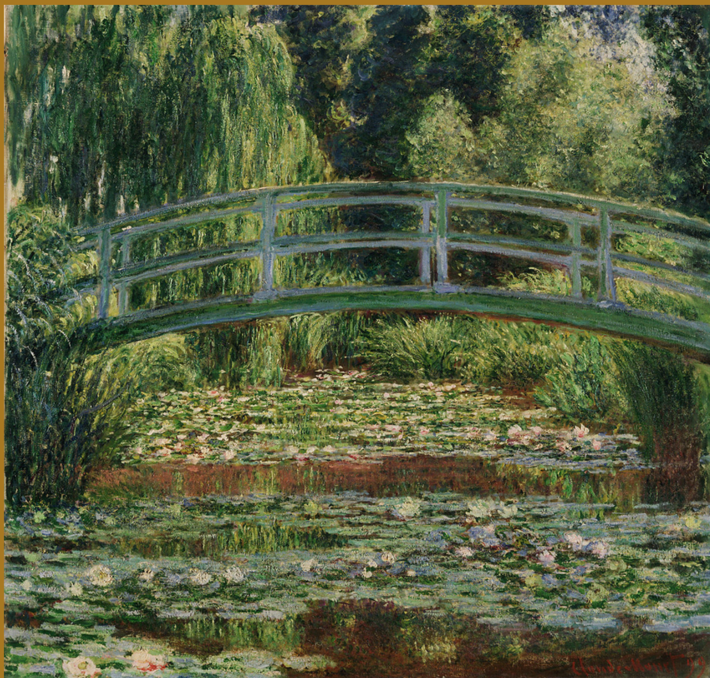
A ponte japonesa e o lago de nenúfares, Claude Monet, 1899, Museu de Arte da Filadélfia, EUA.