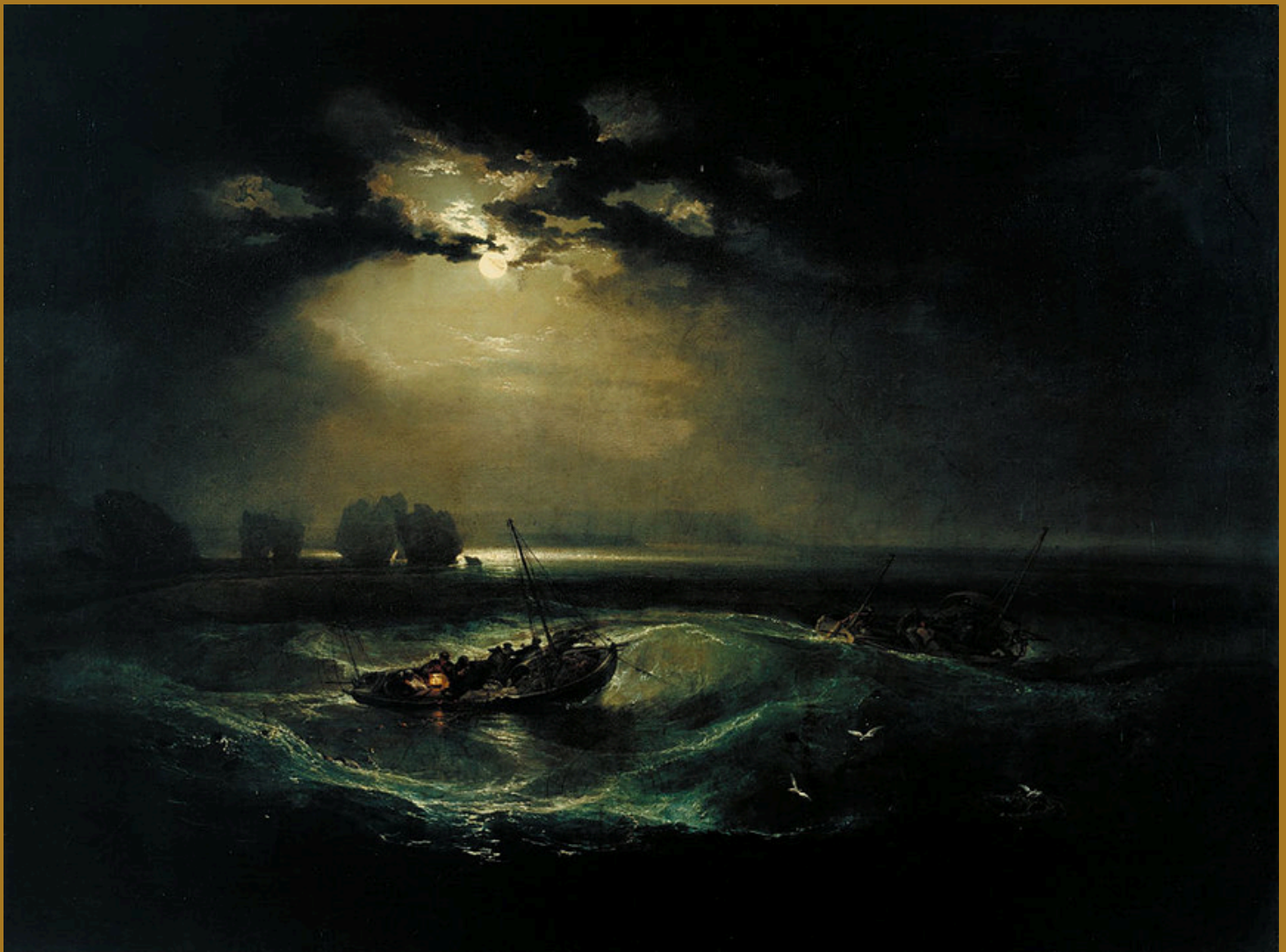
Pescadores no mar , Wiliiam Turner, 1796, Tate Gallery, Londres, Inglaterra.