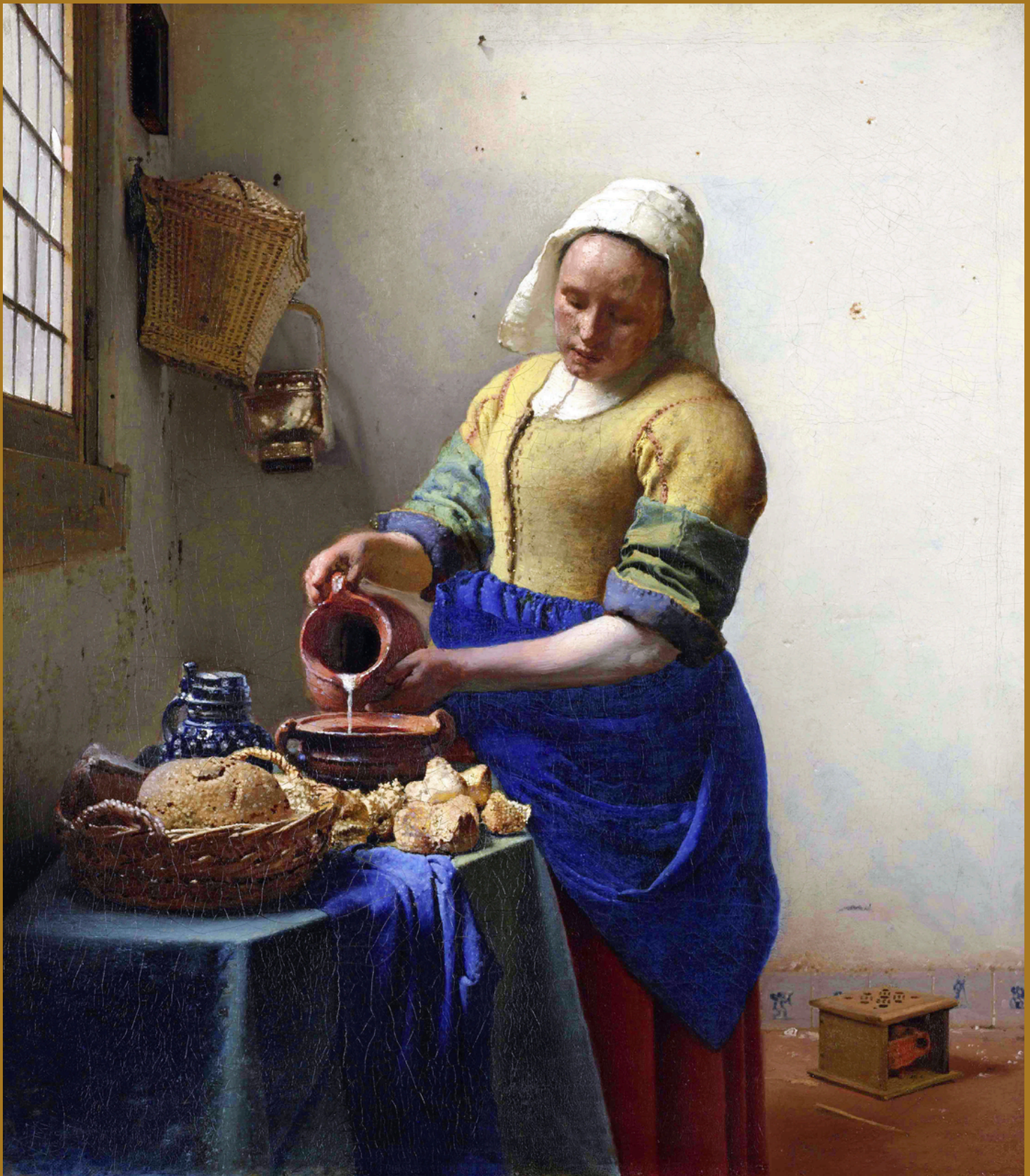
A leiteira , Johannes Vermeer, 1660, Rijksmuseum Amsterdam, Holanda.