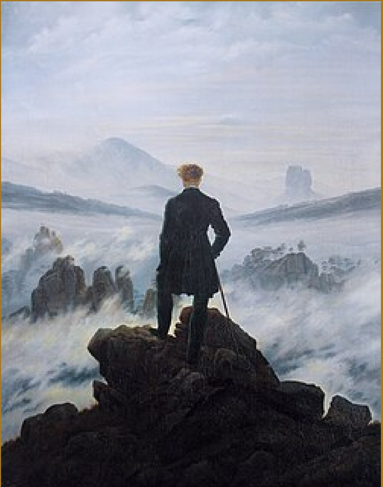
Caminhante sobre o mar de néveoa , Caspar David Friedrich, 1818, Hamburger Kunsthalle, Hamburgo, Alemanha.