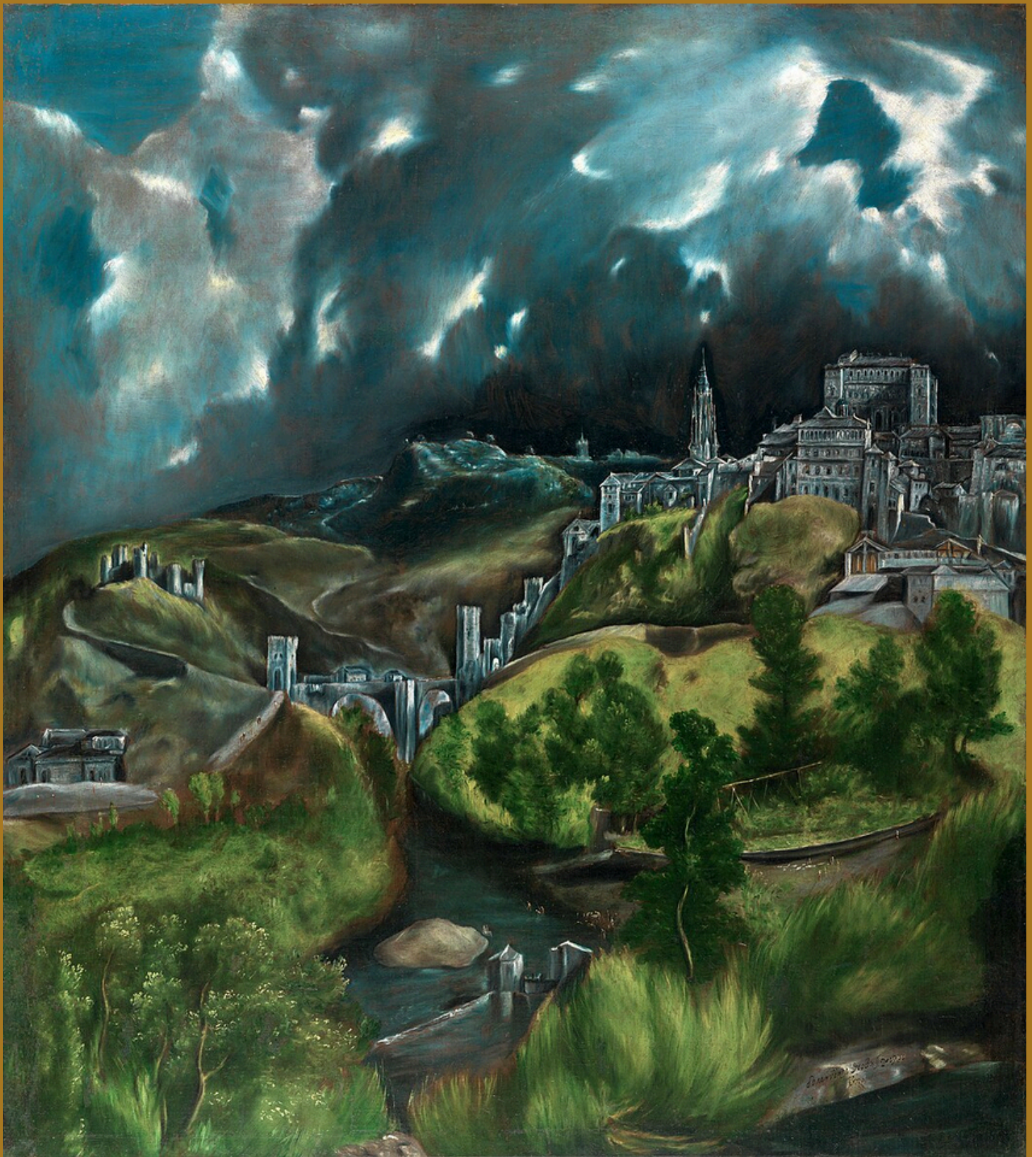
Vista de Toledo , El Greco, c. 1599-1600, The Metropolitan Museum of Art, Nova York, EUA.