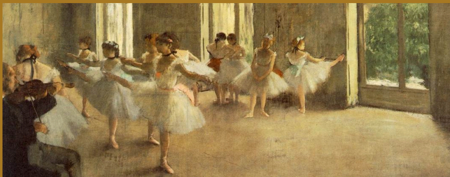
A aula de dança , Edgar Degas, 1876, Musée d'Orsay, Paris, França.