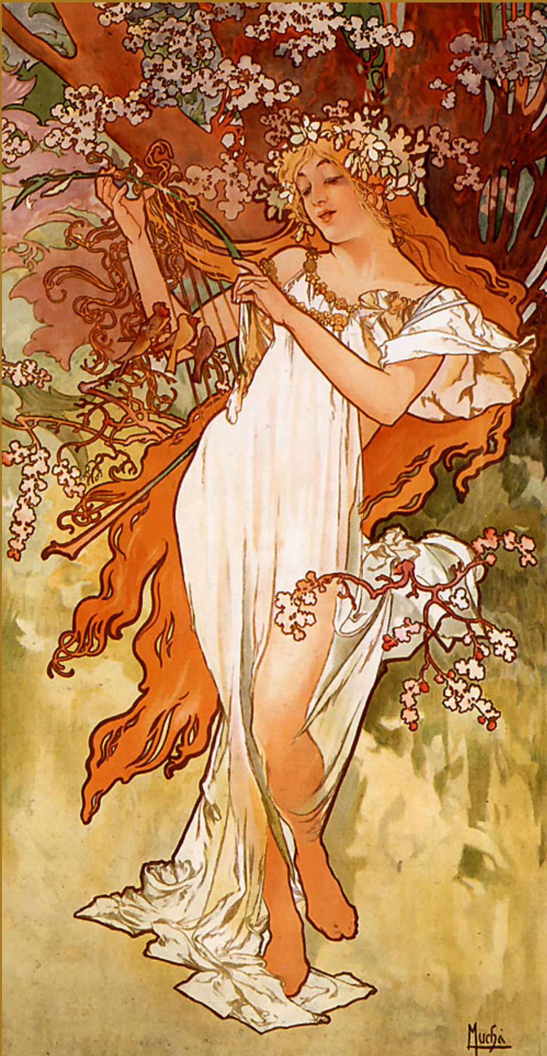
Primavera , Alphonse Mucha, 1896, Museu Mucha, Praga, República Tcheca.