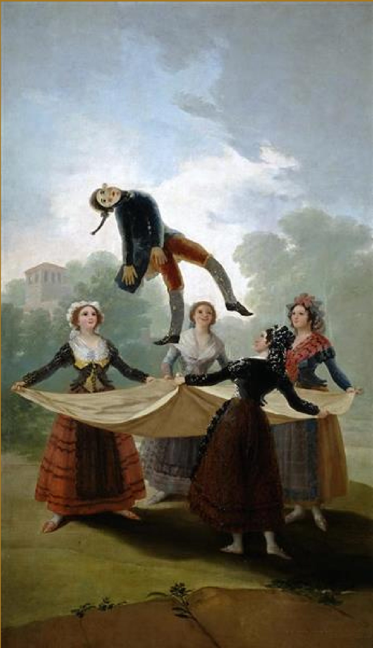
O boneco de palha , Francisco de Goya, 1792, Museu do Prado, Madri, Espanha.