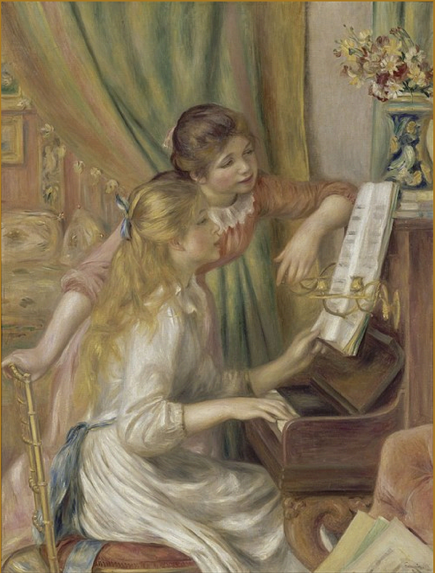
Raparigas ao piano , Pierre-Auguste Renoir, 1892, Musée d'Orsay, Paris, França.