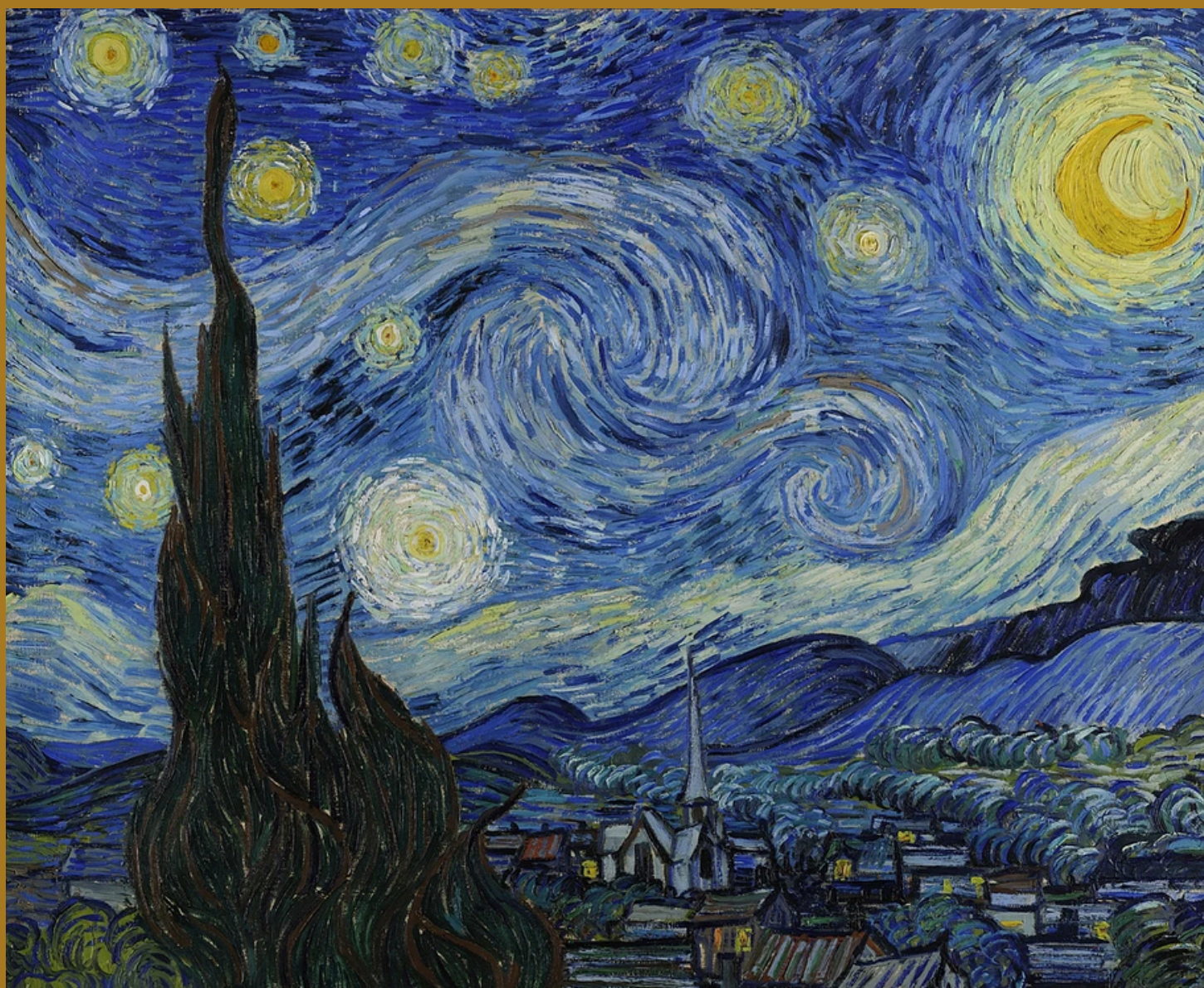
A noite estrelada , Vincent van Gogh, 1889, Museu de Arte Moderna (MoMA), Nova York, EUA.