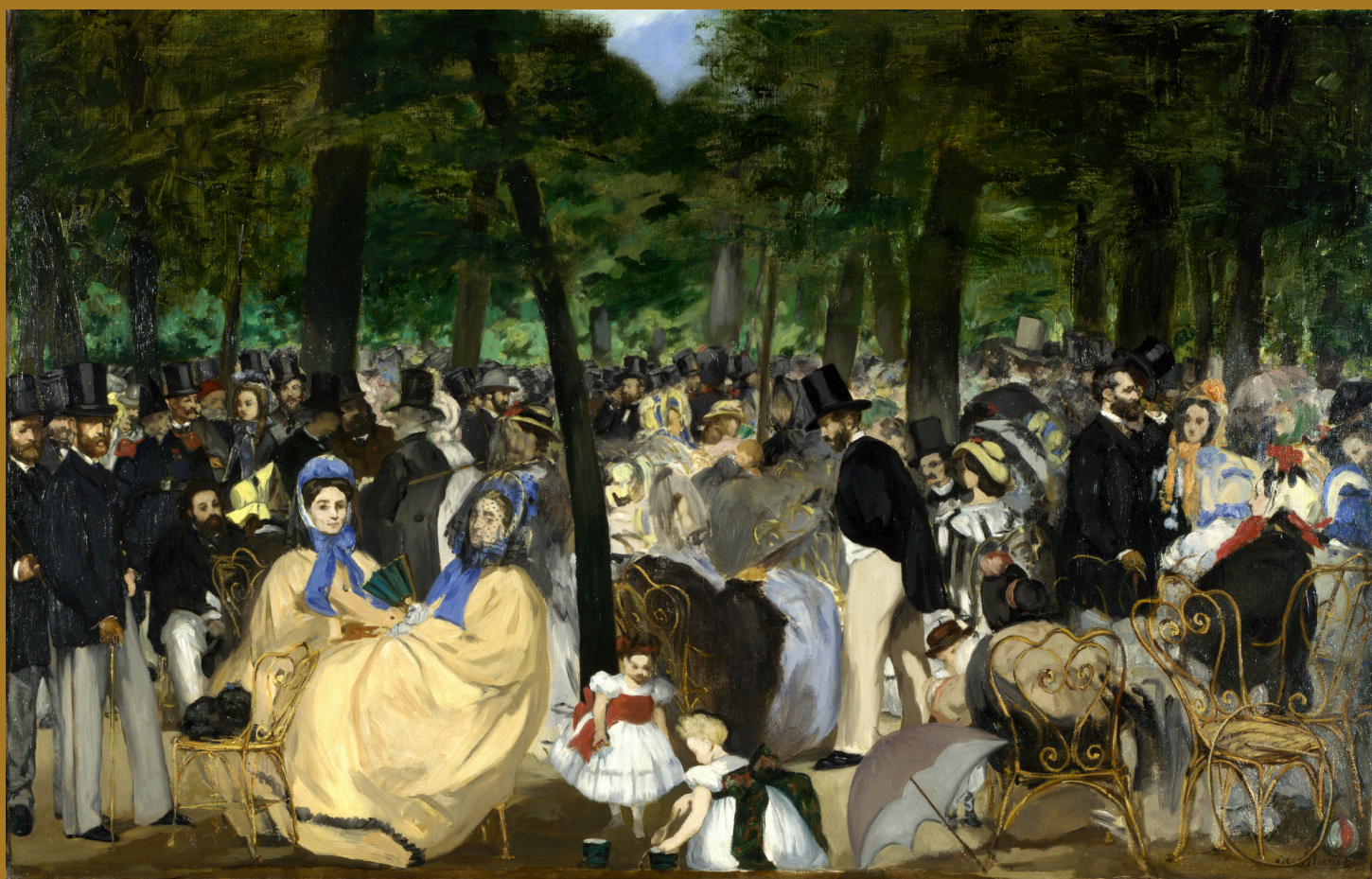
Música no Jardim das Tulherias , Édouard Manet, 1862, National Gallery, Londres, Inglaterra.