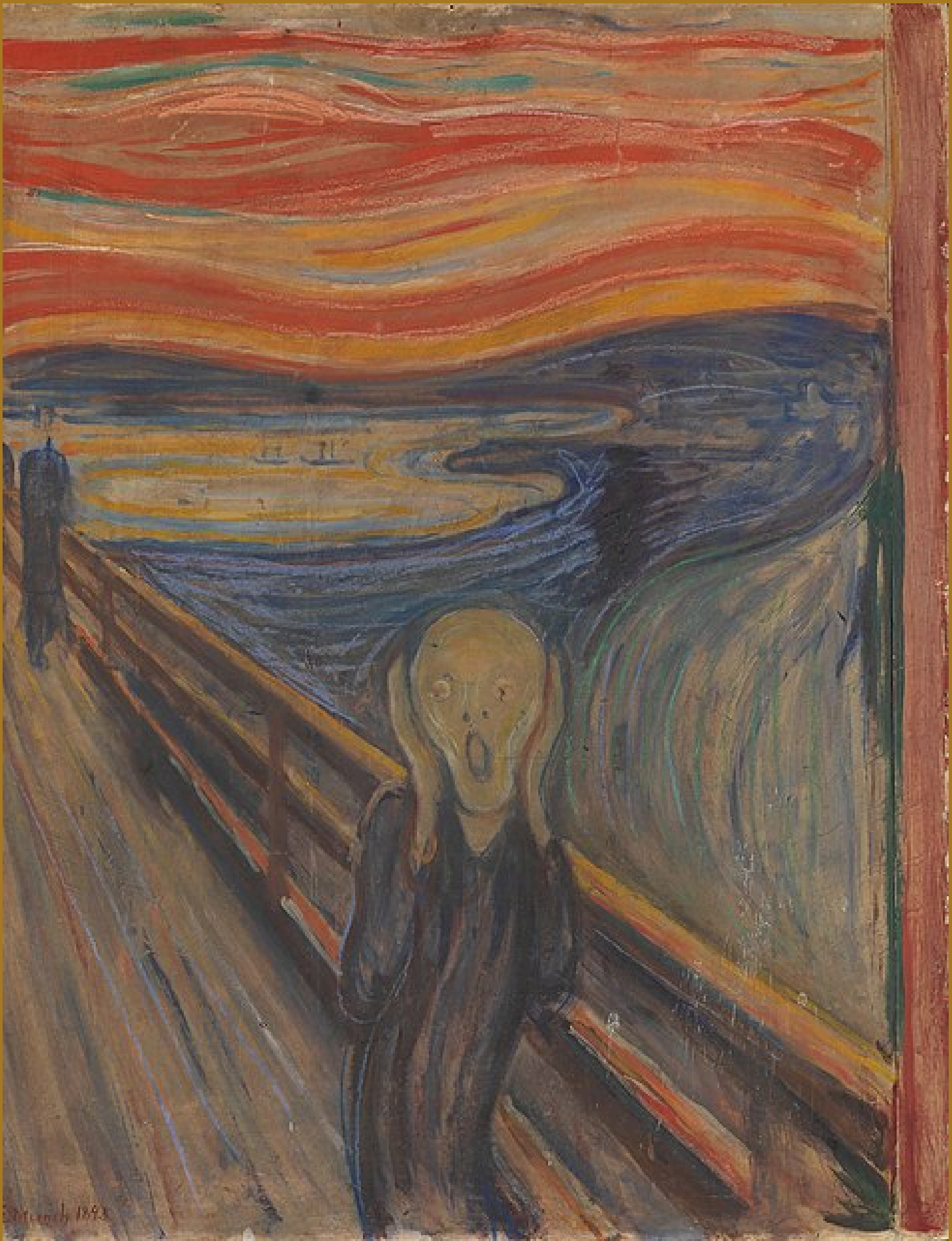
O grito , Edvard Munch, 1893, Museu Munch, Oslo, Noruega.