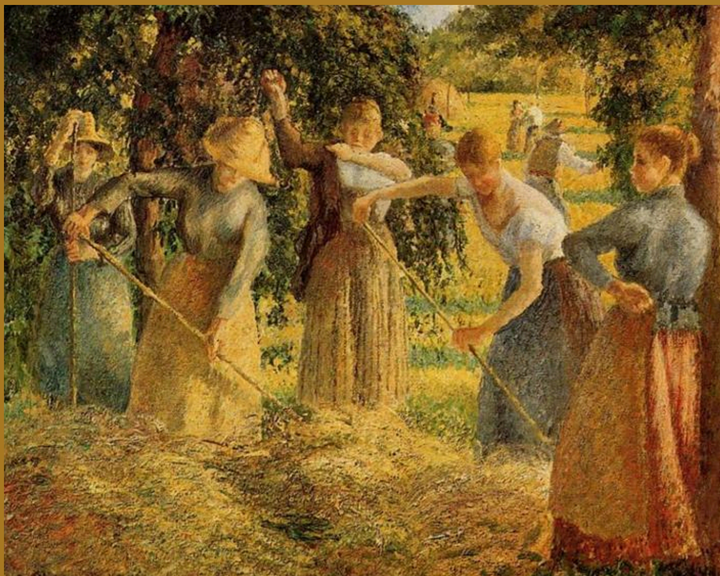
Colheita de feno em Éragny , Camille Pissarro, 1901, Galeria Nacional do Canadá, Ottawa, Canadá.